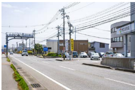
国道8号線本郷西交差点方面から来た入口