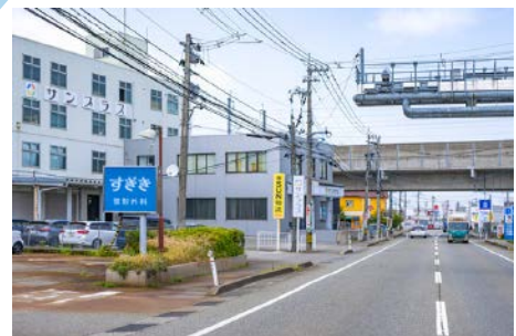
富山西IC方面から来た入口